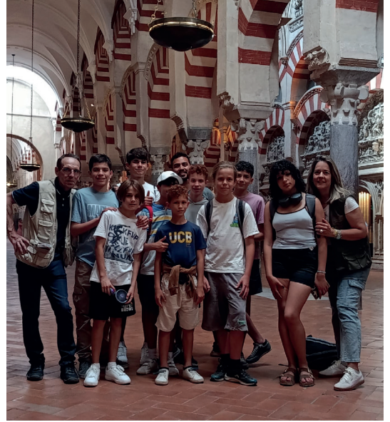
▲ Última visita del 'Proyecto Red de Corresponsales Juveniles del Patrimonio Natural', que tuvo lugar en Córdoba.