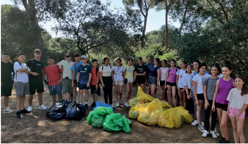
▲ El alumnado de 1º ESO del IES Olontigi participa un año más en el proyecto LIBERA de Ecoembes y SEO Birdlife con el que el Ayuntamiento colabora, centrado en mantener limpio los espacios naturales.