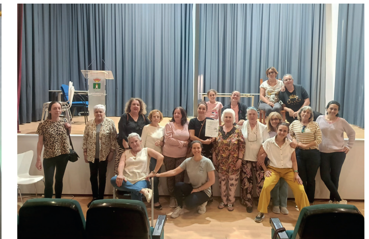
▲ Presentación del Taller Municipal de Teatro Social para la sensibilización en diversidad e igualdad, que preparará durante el mes de junio su próxima representación.