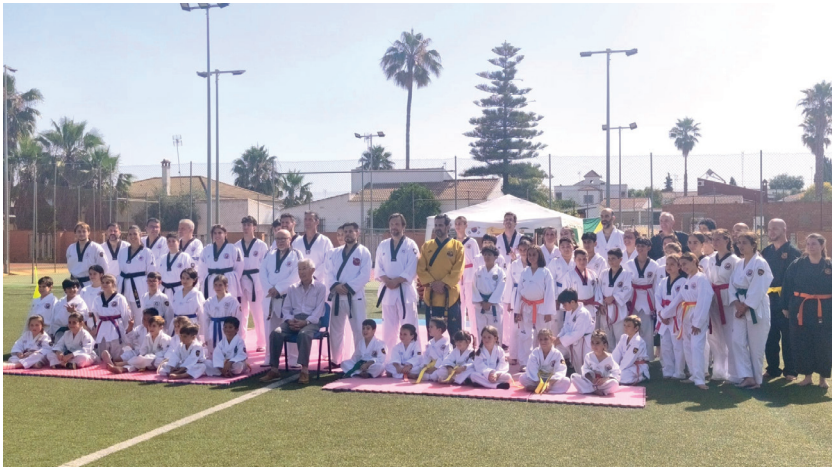
▲ Acogimos el encuentro de clubes de Taekwondo, en el que participaron Aznalcázar, Tomares y Espartinas y como club invitado el Do San Kwan de Sanlúcar la Mayor.