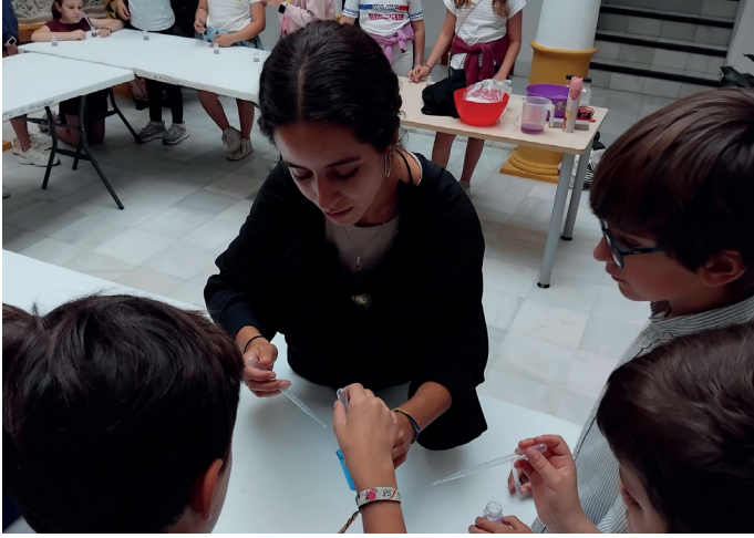
▲ Celebramos el taller de divulgación científica "El laboratorio de Marie Curie", correspondiente al Programa Ciencia al Fresquito Primavera para niños/as de 7 a 11 años.