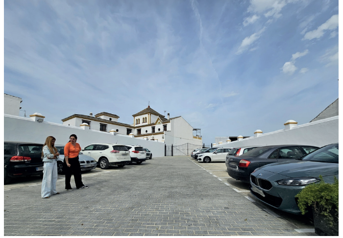
▲ Visita a la obra de adecuación y creación de bolsas de aparcamiento en el Recinto Ferial que cuenta con un presupuesto total de 284.328,15 € a través del PFEA 2025.