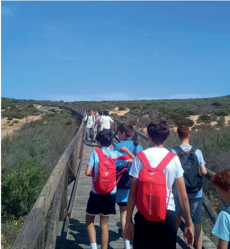
◀ Los 15 jóvenes del 'Proyecto Red de Corresponsales Juveniles del Patrimonio Natural', junto a familias y vecinos del municipio, visitaron el paraje El Asperillo, un espacio único de dunas fósiles dentro del entorno de Doñana.