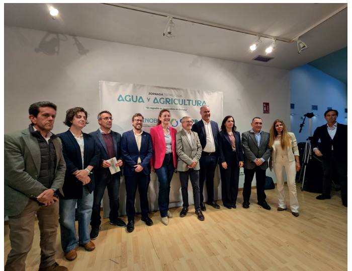
▶ Encuentro en Aznalcázar sobre el futuro del agua y la agricultura en Doñana, con la participación del secretario de Estado Hugo Morán y más de 150 representantes institucionales y profesionales del sector.