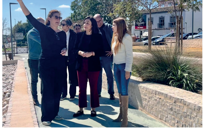
▲ Visita de la diputada de Cohesión Territorial a las obras ejecutadas por el Programa de Fomento de Empleo Agrario (PFEA). Todas estas actuaciones han supuesto más de 272.000 euros de inversión y la creación de 67 contratos.