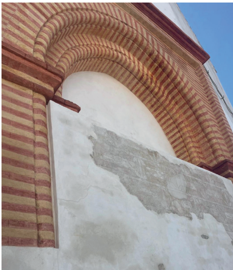
▲ Finalizados los trabajos de restauración de la portada norte de la Iglesia Parroquial de San Pablo a través de la subvención de Municipios Turísticos de Andalucía.