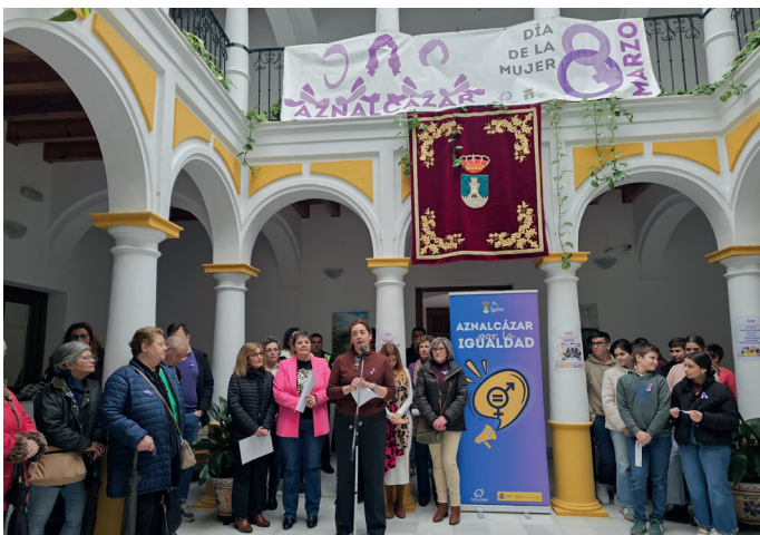
▲ La Asociación de Mujeres ASOMA, el Taller de Meditación, el CEIP Ntro. Padre Jesús, el IES Olontigi y el CEPA Aznalcázar, participaron en la lectura de manifiesto con motivo del 8M (Día Internacional de la Mujer)