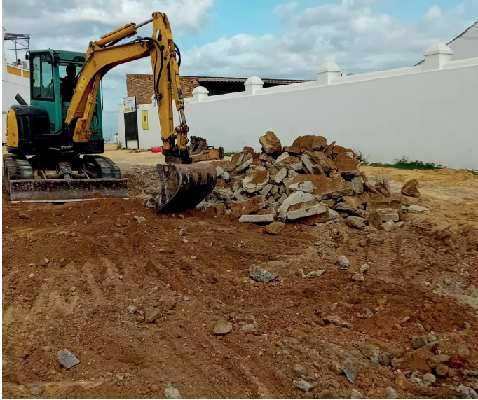
▲ Comienza la obra del Recinto Ferial para que pueda combinar su uso tradicional durante la Feria con el de bolsas de aparcamiento y parque urbano abierto a la ciudadanía.