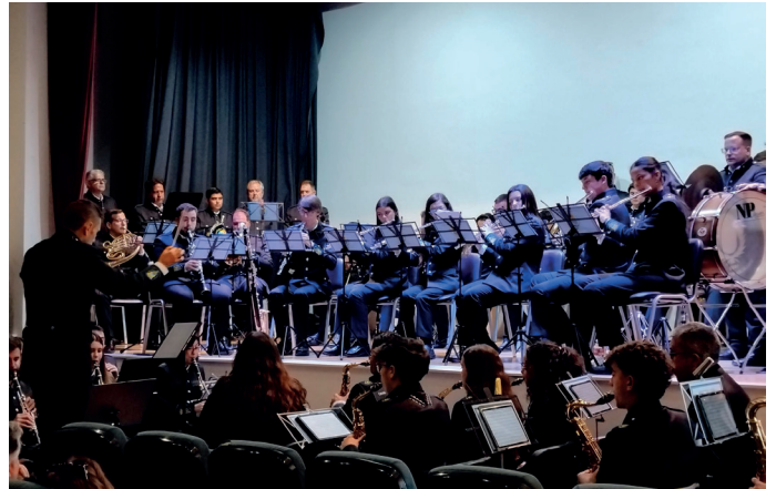
▲ El Programa Cultural SONES DE CUARESMA 2026 ofreció un nuevo Concierto de Marchas de Semana Santa con la Banda Municipal de Música de Villalba del Alcor.