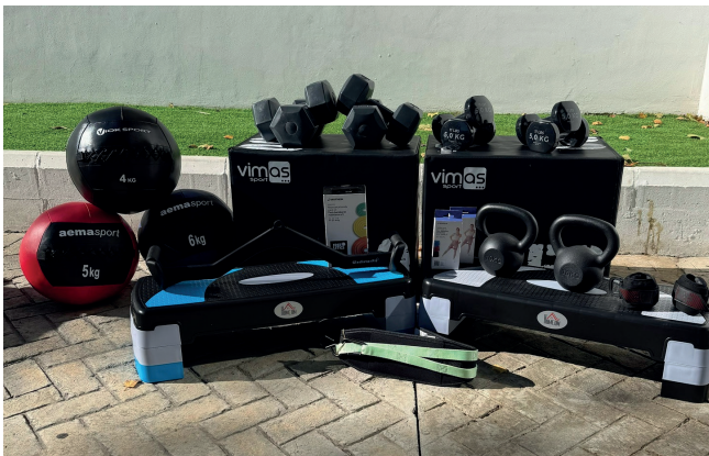
▲ El Área de Deportes adquiere nuevo material tanto para el gimnasio como para las clases dirigidas. Seguimos trabajando para mejorar nuestras instalaciones.