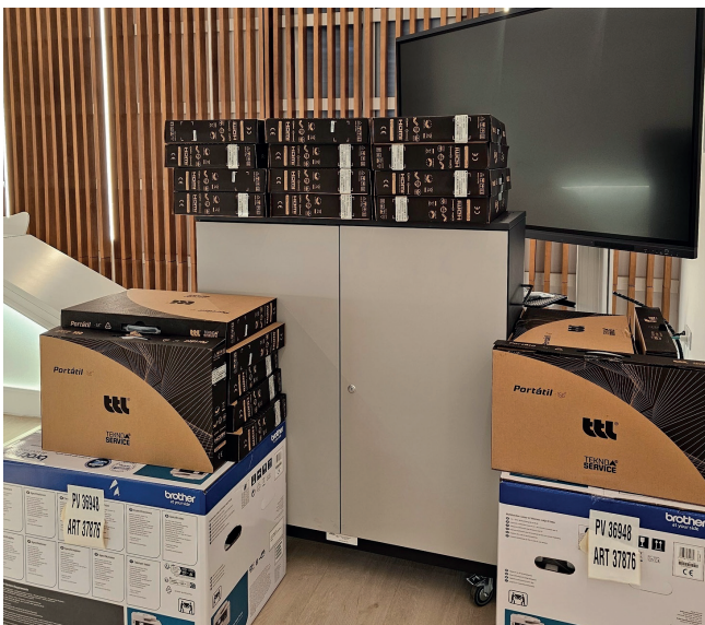
▲ Adquirido el equipamiento informático para un aula móvil de formación, gracias a la subvención del Área de Concertación de Diputación de Sevilla de 23.405€.