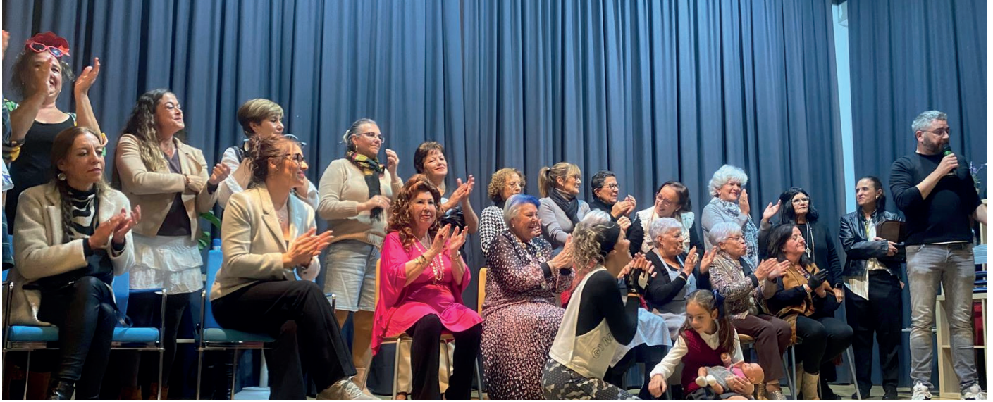
▲ El grupo de teatro con perspectiva de género de Aznalcázar estrenó su obra 'Me llaman loca' el domingo 30 de noviembre.