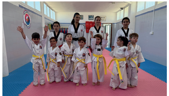
▲ Los chicos y chicas de la escuela de taekwondo realizaron, antes de las vacaciones de Semana Santa, las pruebas para el cambio de cinturón, obteniendo muy buenos resultados.