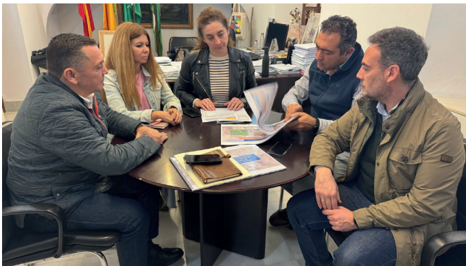
▲ Aljarafesa presentó al Ayuntamiento el estudio para mejorar la red de saneamiento del Polígono Torrealcázar con un nuevo colector marginal en calle Almena para evitar problemas durante lluvias intensas.