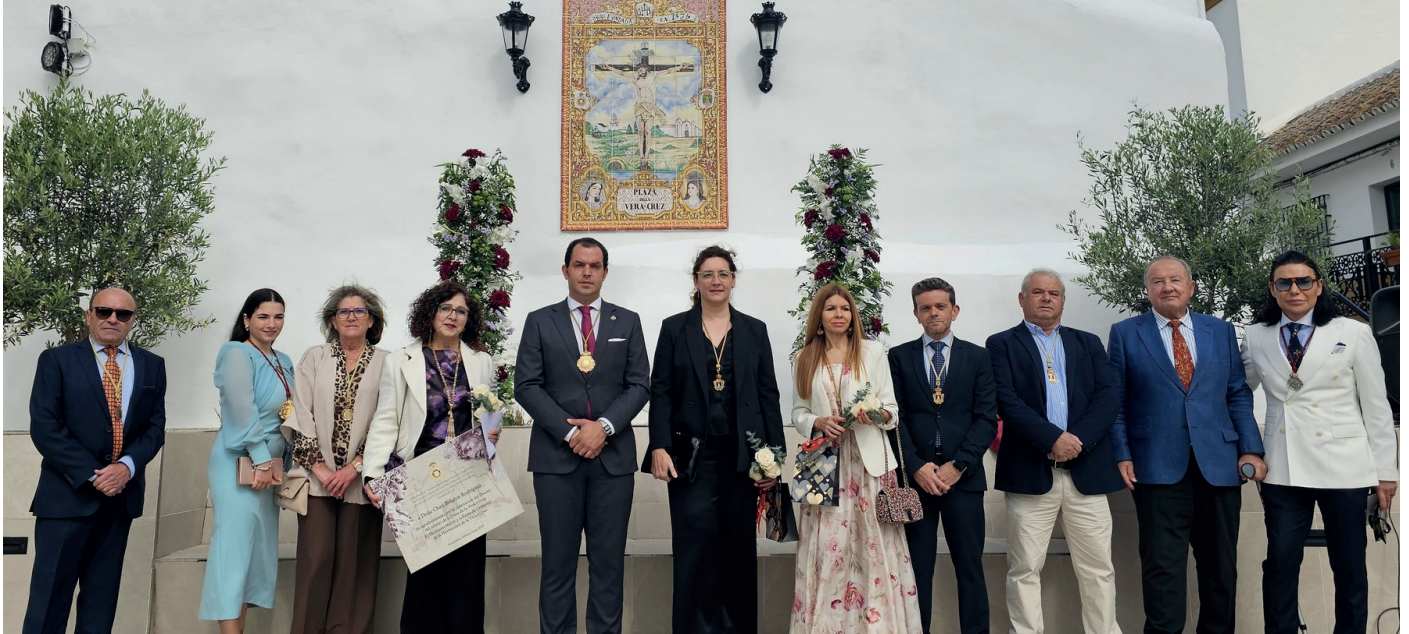
▲ El Domingo de Resurrección se inauguró el azulejo que preside la Plaza de la Vera Cruz, creado por Chari Bolaños, que lleva la imagen de los titulares de la Hermandad de la Vera Cruz, así como su capilla y detalles del pueblo.