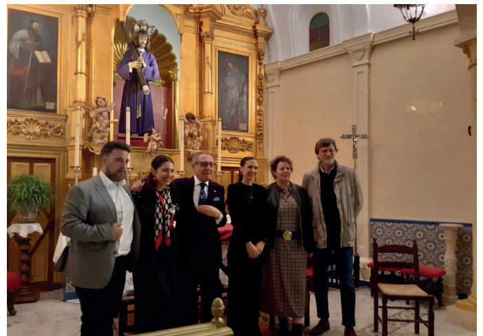
▲ La Capilla de Padre Jesús de Aznalcázar acogió la primera de las jornadas del Programa Cultural SONES DE LA CUARESMA 2025.