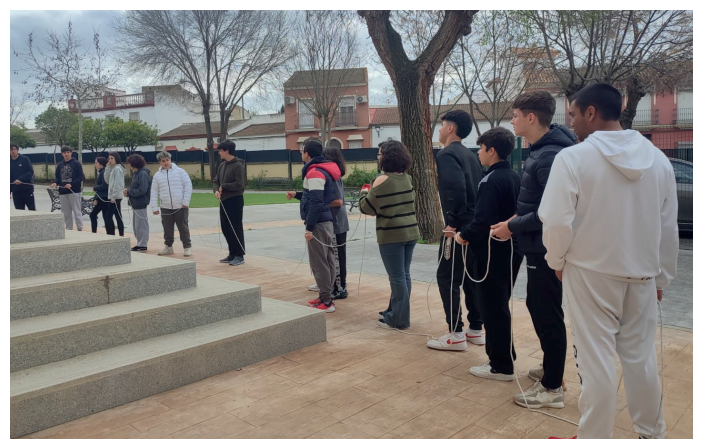
▲ Desarrollado en el IES Olontigi el taller sobre Arte y Diversidad, una actividad organizada desde el área de Juventud y subvencionada a través del Grupo de Desarrollo Rural Aljarafe-Doñana (ADAD) a través del programa LEADER, que cofinancia el FEADER de la Unión Europea y la Consejería de Agricultura, Pesca, Agua y Desarrollo Rural.