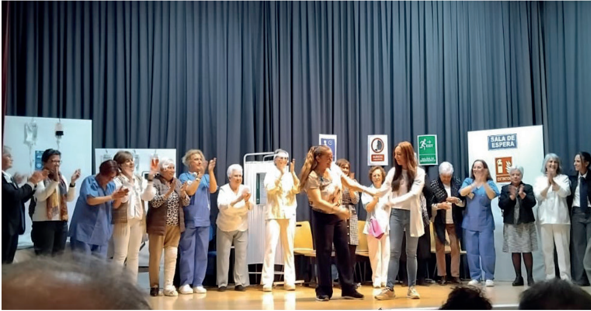
◀ Estreno de la obra de teatro social 'Siempre fue mi culpa' interpretada por las alumnas del taller de teatro organizado desde el área de Igualdad.