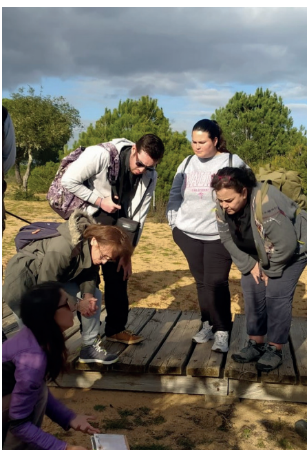
◀ Salida de campo del curso de formación 'Cualifica Doñana', enmarcado en el proyecto Compartiendo Doñana, financiado con cargo al programa de la Red de Parques Nacionales y subvencionados por la Consejería de Sostenibilidad Medio Ambiente y Economía Azul.