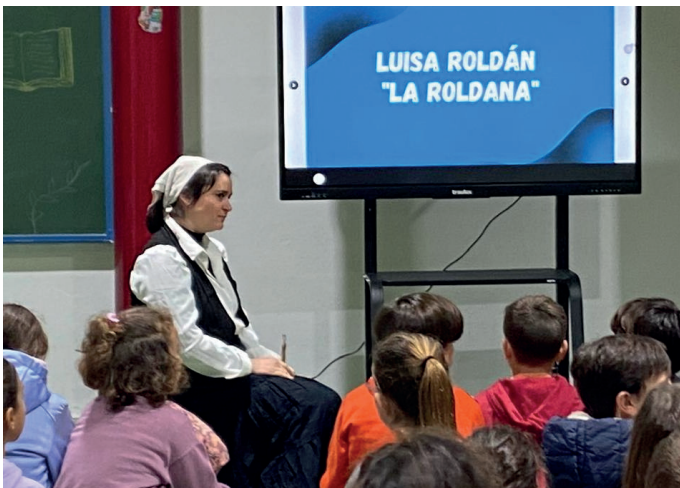
▲ El alumnado del CEIP Ntro. Padre Jesús disfrutó de la obra de teatro 'Las que no están en los libros' una actividad organizada desde el área de Igualdad del Ayuntamiento.